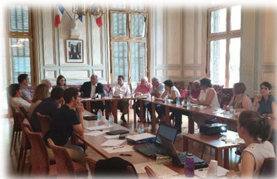
Figure 4 - Atelier de concertation, le 1 juillet 2019

Le débat a permis de faire émerger des pistes d'actions en adéquation avec les enjeux du territoire et les objectifs identifiés par les élus lors du séminaire. Des fiches actions étaient fournies pour permettre la description détaillée de chaque proposition faite. Elles ont été remplies au fur et à mesure du débat par M. FEBVAY en charge du dossier PCAET à la CCRM.