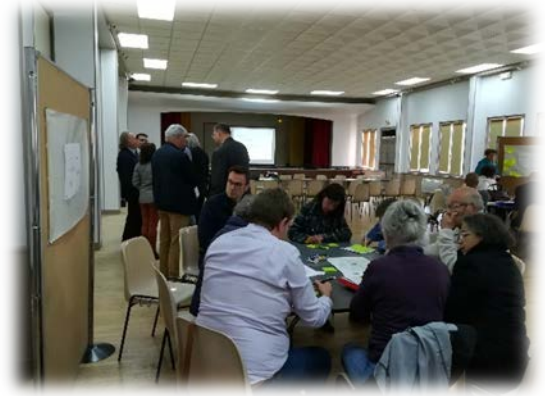
Figure 3 - Forum de lancement, le 29 avril 2019

L'ensemble des propos ont été recueillis à l'issue des débats. Par ailleurs, un collectif d'acteurs de la société civile composé de citoyens et d'associations locales, réuni à l'initiative de l'association Sologne Nature Environnement (SNE), avait synthétisé des propositions pour le PCAET au sein d'un document disponible en annexe . Ces propositions concernent les activités économiques (dont agriculture et sylviculture), la gestion des déchets, la mobilité des personnes et des biens, l'occupation des sols et enfin l'énergie (consommée et produite).