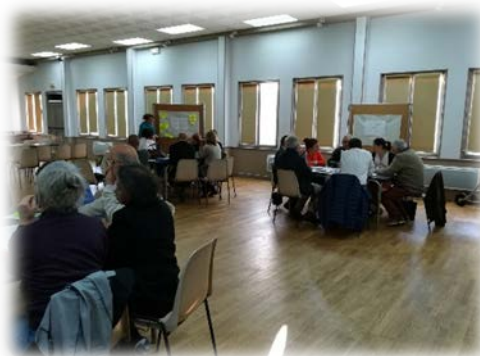
Figure 2 - Forum de lancement 29 avril 2019

L'objectif de ce forum est de s'assurer d'une bonne appropriation des enjeux et mesures associés à l'élaboration d'un PCAET, ainsi que de mobiliser les partenaires et acteurs du territoire pouvant ensuite soutenir la Communauté de communes dans l'élaboration et le suivi de son plan d'actions.