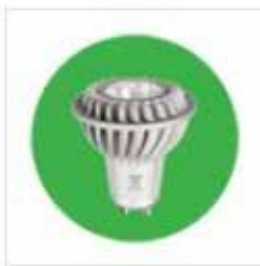
Lampe à LED