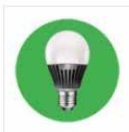
Lampe à LED